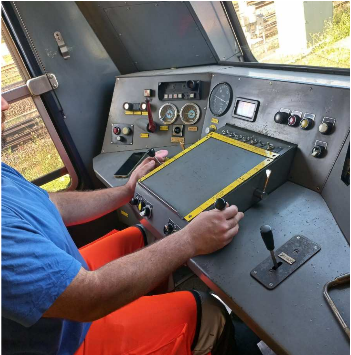
Cabine de conduite, coté I , avec un nouvel adhérent en formation à la conduite