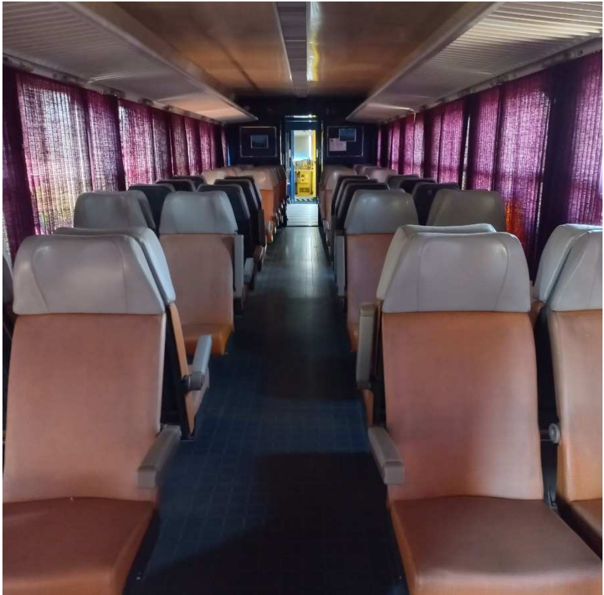
L'espace voyageurs (en partie) 100 places