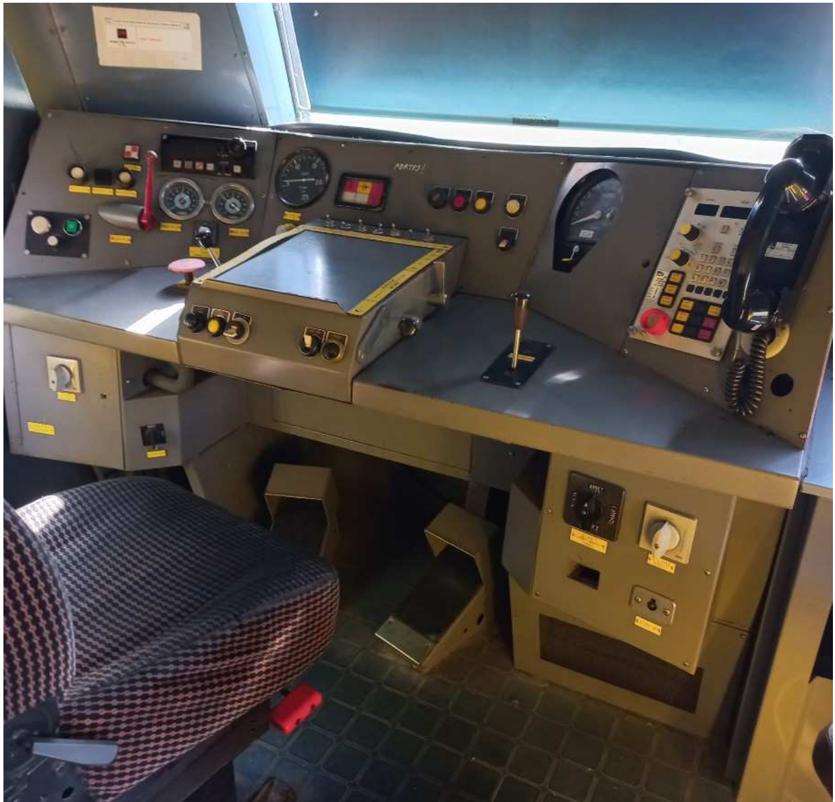
Cabine de conduite, coté II