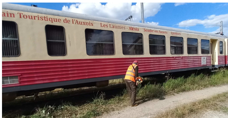
Nettoyage autour des autorails