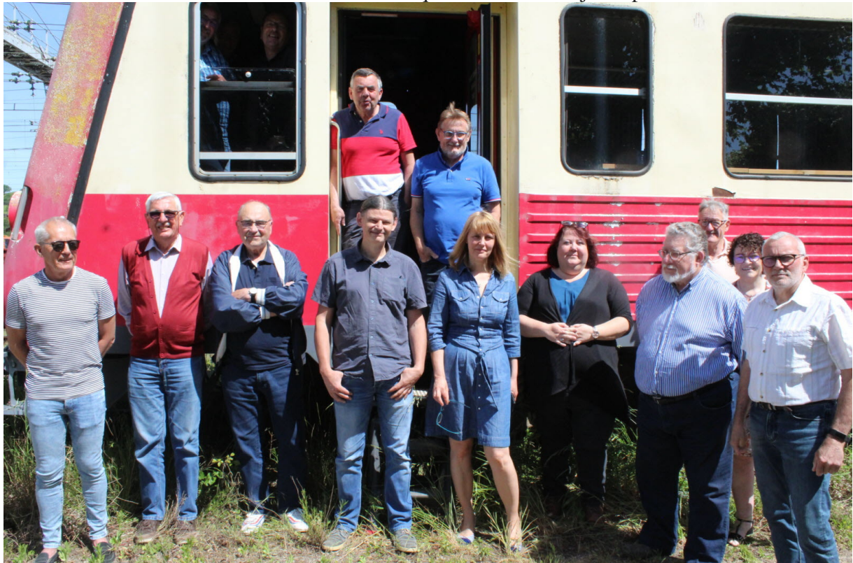
Le Conseil d'Administration de l'ACTA

Reste fixée à 10 €. Le montant étant modique un don est toujours possible.